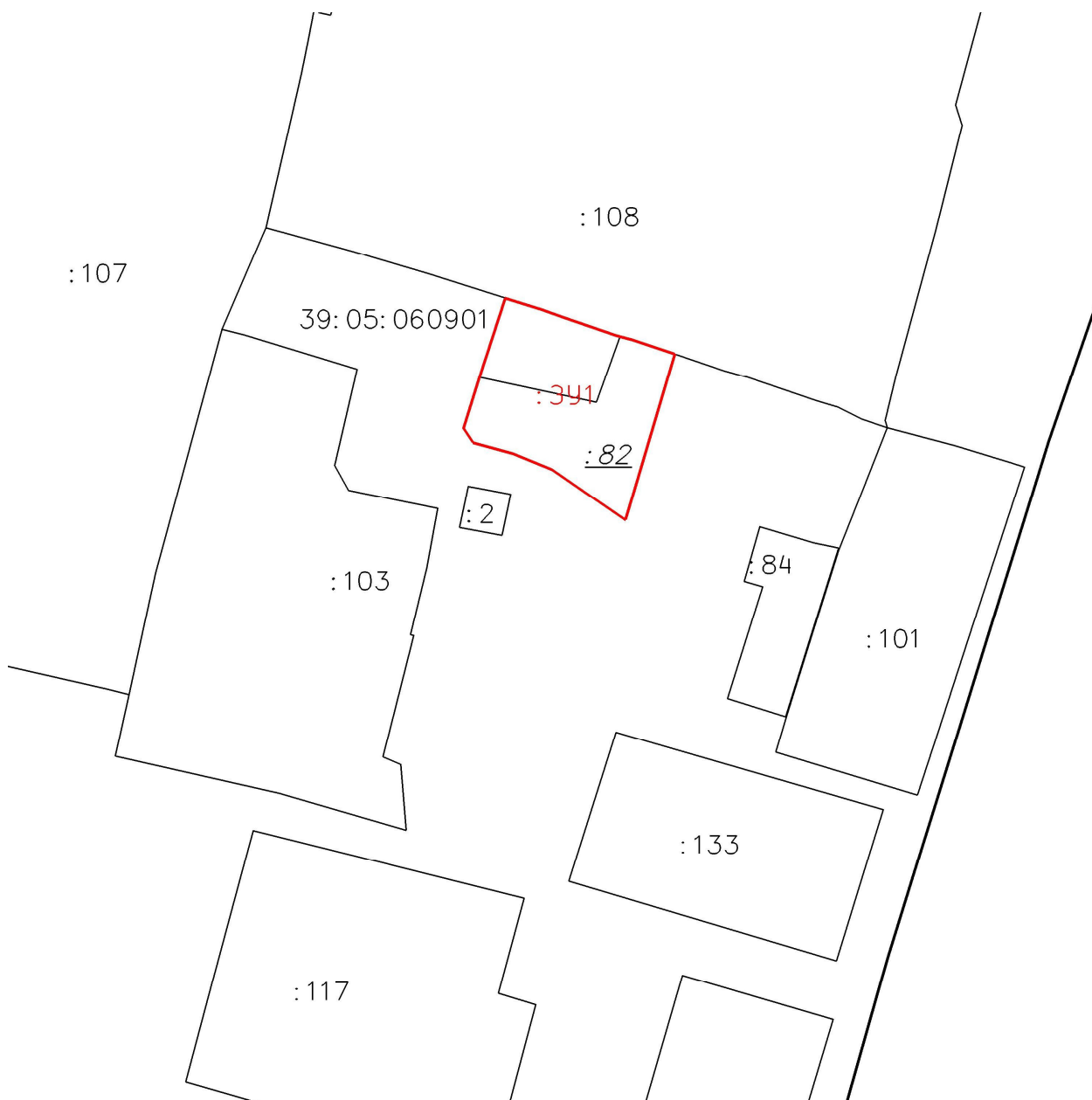
Схема расположения земельных участков

Условные обозначения приведены в приложении